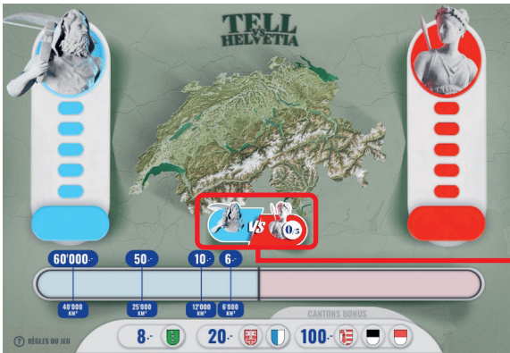
Exemple: Le montant gagné est de Fr. 10.-