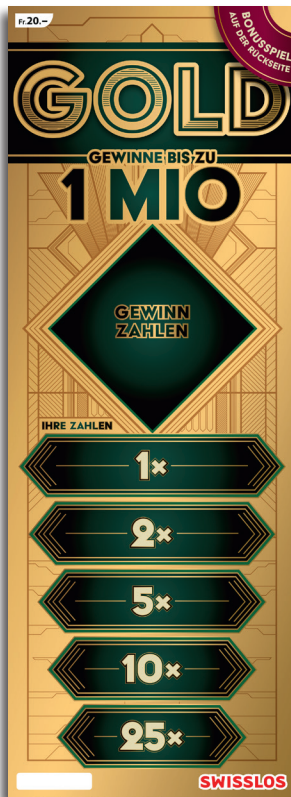
Beispiel: Gewinn Fr. 1'000.-